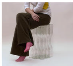
Bottle Seat 27 bottles, 30 pieces 500 x 150 x 350 mm 2004

Ιδέα για «πράσινη» επιχειρηματική δραστηριότητα (στο πλαίσιο του προγράμματος Μάθηση και Επιχειρείν ):