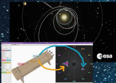
«Ξύπινα Ροσέττα» Ρυθμική ηχοποίηση βαρυτικής σφενδόνης (βραβείο ESA 2014)