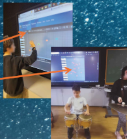
Αντιστοίχιση χρωματικής κλίμακας με έννοιες της Φυσικής