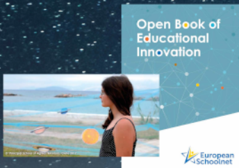
Global Science Opera in real time Δημοσιευμένη καλή πρακτική του Ευρωπαϊκού Schoolnet