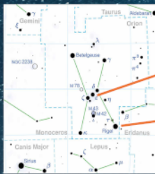
Αστερισμός του Ορίωνα (Δράση: «Ήχοι των Αστρων»)