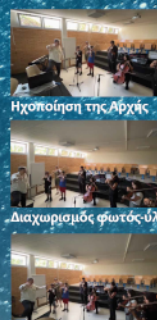
Ηχοποίηση μεγεθών από τη Γένεση του Σύμπαντος