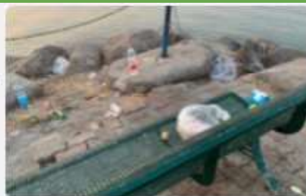
זיהום מקורות מים חוף גיבוסר

להפסיק להשליך פסולת למקורות מים! פסולת זו מזהמת את המים שלנו!