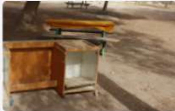
פסולת בניין ורהיטים חורשה במצפה רמון