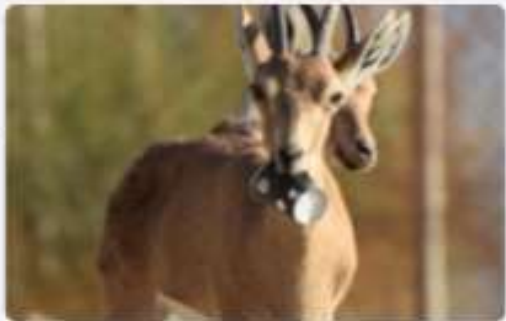
החיות ניזוקות עין גדי, צילום: גיל כספי

החיות ניזוקות מפסולת שנזרקת בסביבה הטבעית! הן רוצות לאכול שאריות בנמצאות בקופסאות שימורים אך נפצעות מהן!!!