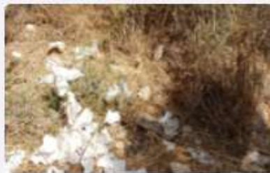
שירותים מאותרים עין אביאל

שרותים מאותרים בשטחים ציבוריים מזהמים את הסביבה! יש להפסיק תופעה זו!