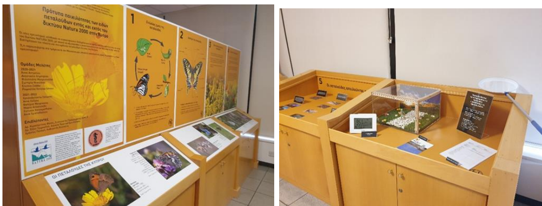
Κυπριακό Μουσείο Φυσικής Ιστορίας (Δάλι)

Η ερευνητική ομάδα του προγράμματος SEMEP 2021-22 με εθελοντική εργασία το καλοκαίρι 2022, ανέλαβε την παρουσίαση της ερευνητικής τους εργασίας στον εκθεσιακό χώρο του νέου Κυπριακού Μουσείου Φυσικής Ιστορίας, του Ιδρύματος Φωτός Φωτιάδης στο Δάλι για ευαισθητοποίηση της κοινότητας σε θέματα διαβίωσης και προστασίας των πεταλούδων του τόπου μας.