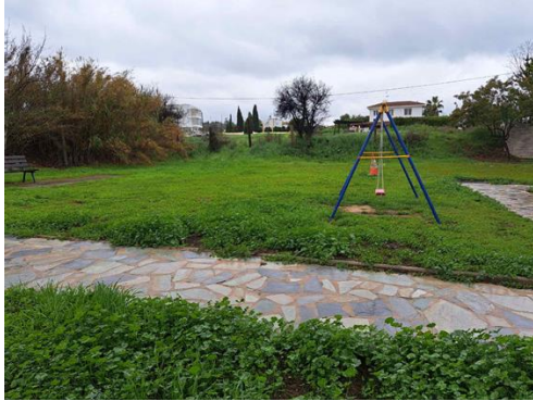
Πάρκο της μάνας στο Πέρα Χωριό Νήσου

βοηθήσει στην ευαισθητοποίηση των κατοίκων όσον αφορά τις πεταλούδες στην περιοχή. Η ομάδα θα συμμετέχει στην επιλογή κατάλληλων ξενιστών των πεταλούδων.