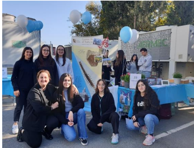
Η ομάδα μας στο SCYENCE FAIR2023