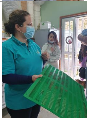
Τρόπος συλλογής πρόπολης.

Κατά την περιήγησή μας στις πυρόπληκτες περιοχές προσπαθήσαμε να βρούμε μέλισσα και να παρατηρήσουμε τη συμπεριφορά των μελισσών σε ένα τόσο πλέον φτωχό από ανθοφορία οικοσύστημα. Τα μέλισσα ήταν ελάχιστα σε σχέση με προηγούμενως και σύμφωνα με πληροφορίες που πήραμε από τηλεφωνική συνέντευξη με τον κ. Κώστα Χειμώνα, ντόπιο μελισσοκόμο με μακρόχρονη εμπειρία, το 75% της μελισσοκομίας έχει καταστραφεί μετά την μεγάλη πυρκαγιά. Οι επαγγελματίες μελισσοκόμοι, παρόλη την στήριξη της κυβέρνησης δυσκολεύονται να ξαναδημιουργηθούν από τις στάχτες που άφησε πίσω της η πυρκαγιά. Ενθαρρυντική είναι όμως η ίδρυση του Κέντρου «Μέλισσα Ζωή» στην πυρόπληκτη Οδού η οποία είναι μια πρωτοβουλία της Τράπεζας Κύπρου και των Ροταριανών Ομίλων Κύπρου, με στόχο την περιβαλλοντική αναζωογόνηση, και την επαναφορά της οικονομικής και επαγγελματικής ανάκαμψης των πυρόπληκτων περιοχών παραγωγής μελιού.