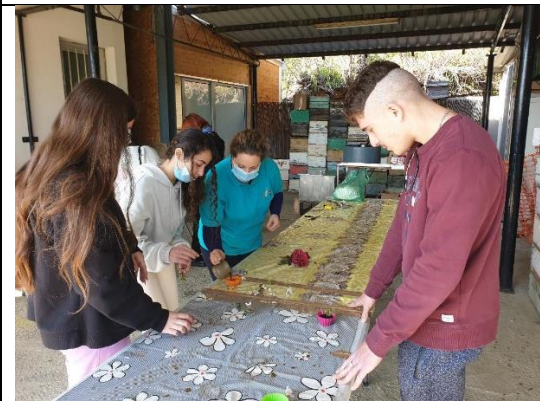
Κατά την κατασκευή κεριών από κεριά μέλισσας.