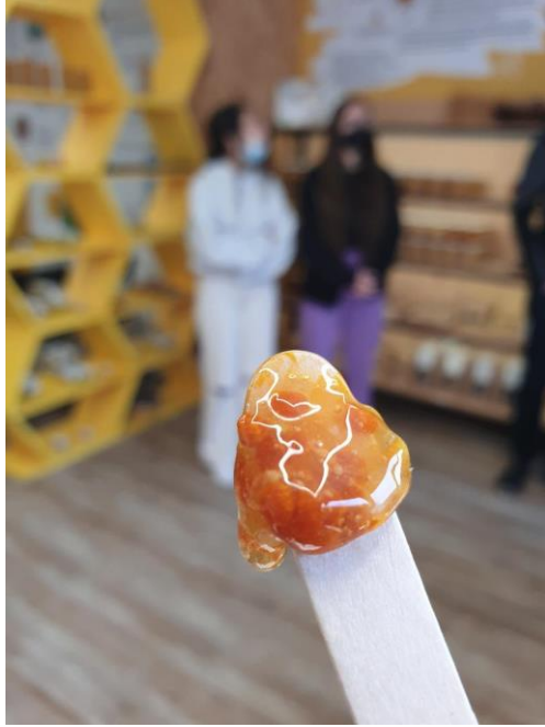
Δοκιμή μελιού με γύρη. Μια σπουδαία υπερτροφή!