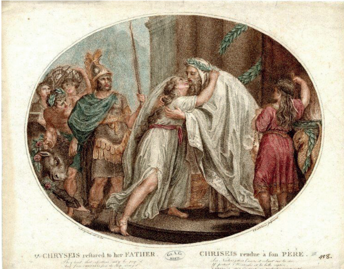
Εικ 1. Chryseis, British Museum, Επιστροφή της Χρυσίδας στον Πατέρα της

Η βασική ιδέα ήταν, στο πλαίσιο του μαθήματος της Ιλιάδας , οι μαθητές να δραματοποιήσουν/αναπαραστήσουν με την τεχνική των παγωμένων ή ακίνητων εικόνων τη σκηνή της σύγκρουσης του Αχιλλέα με τον Αγαμέμνονα για την επιστροφή της Χρυσίδας στον πατέρα της.